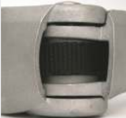
Käsivarsissa Dyneema® nauha