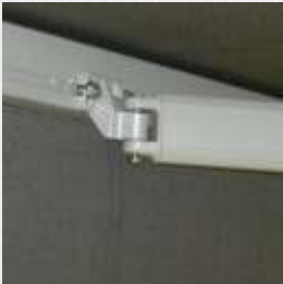
Käsivarren kiinnitys etuprofiiliin